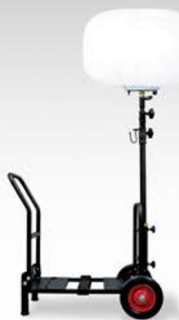
BL-210-FD 輝夜 210W 全光バルーン小型台車タイプ