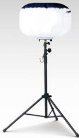
BL-210-S 輝夜 210W 反射バルーン小型三脚タイプ