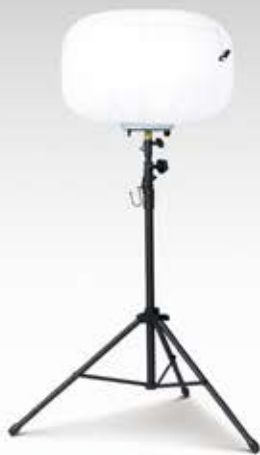
BL-210-F 輝夜 210W 全光バルーン小型三脚タイプ