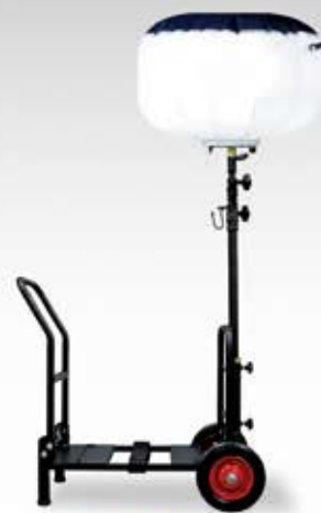
BL-210-SD 輝夜 210W 反射バルーン小型台車タイプ