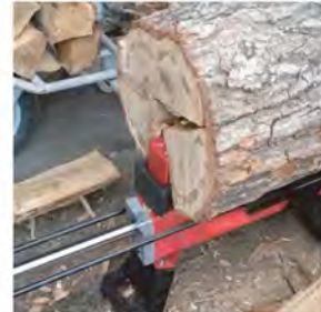
徐々に既存の刃が木を割っていきます