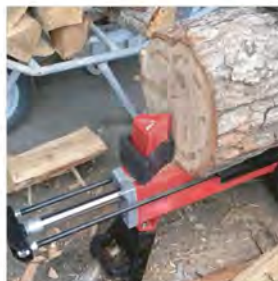
堅い玉切りの縁側に割れのきっかけができる