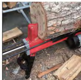
標準の刃で割れない