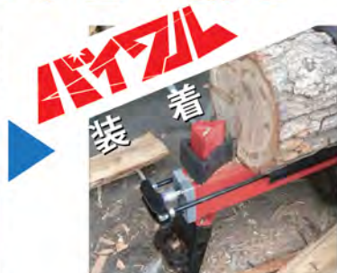
バイワルがまずクサビの要領で切り込んでいく