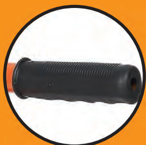
グリップハンドル