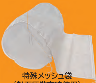
特殊メッシュ袋 (粉石灰散布時使用)