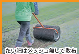
たい肥はメッシュ無しで散布