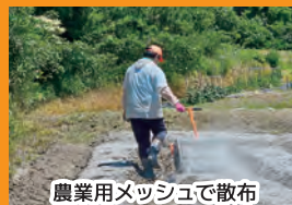
農業用メッシュで散布