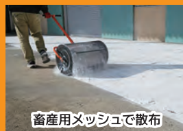
畜産用メッシュで散布