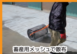
畜産用メッシュで散布